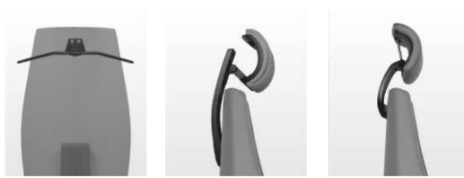
M/KK161 M/KK162 M/KK078