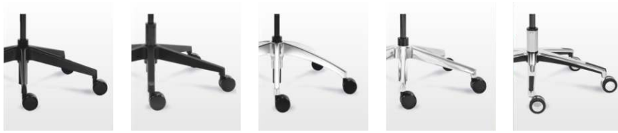
ST014 ST015 ST005 ST013 ST020