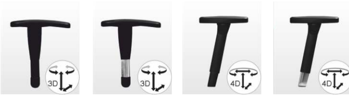
AR009/10 AR007/08 AR018/19 AR037/38