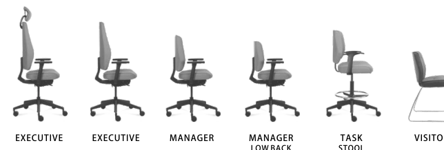
EXECUTIVE EXECUTIVE MANAGER MANAGER LOW BACK TASK STOOL VISITOR